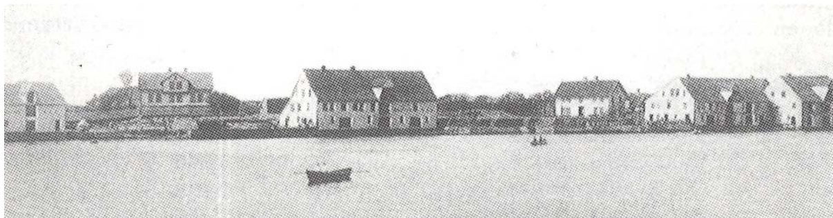
Vibrandsøy ca.1917 med Bergesen-huset i sentrum. Med unntak av sjøhuset lengst til høyre er bygningsmasse og landskap uforandret.