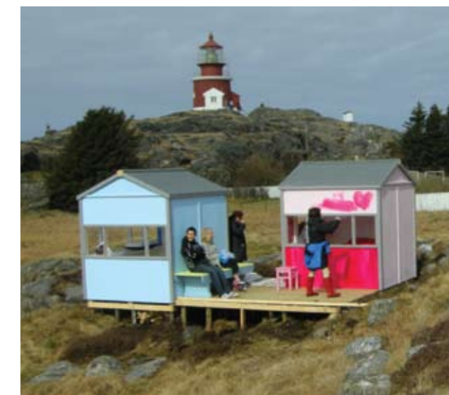
3 små hytter er et kunstprosjekt av Solveig Egeland, formidlet til Utsira kommune gjennom prosjektet Kultur & Næring.

I november 2010 ble fotokunstprosjektet "Fjord Impressions" vist i Brussel under den store norske kunstutstillingen Norway Now. "Fjord Impressions" er et felles prosjekt mellom 7 foto/videoaktører fra regionen, og bestod av 120 utstilte bilder og en foto/videopresentasjon via skjermer. Samarbeidet mellom fotografene vil bli videreført.