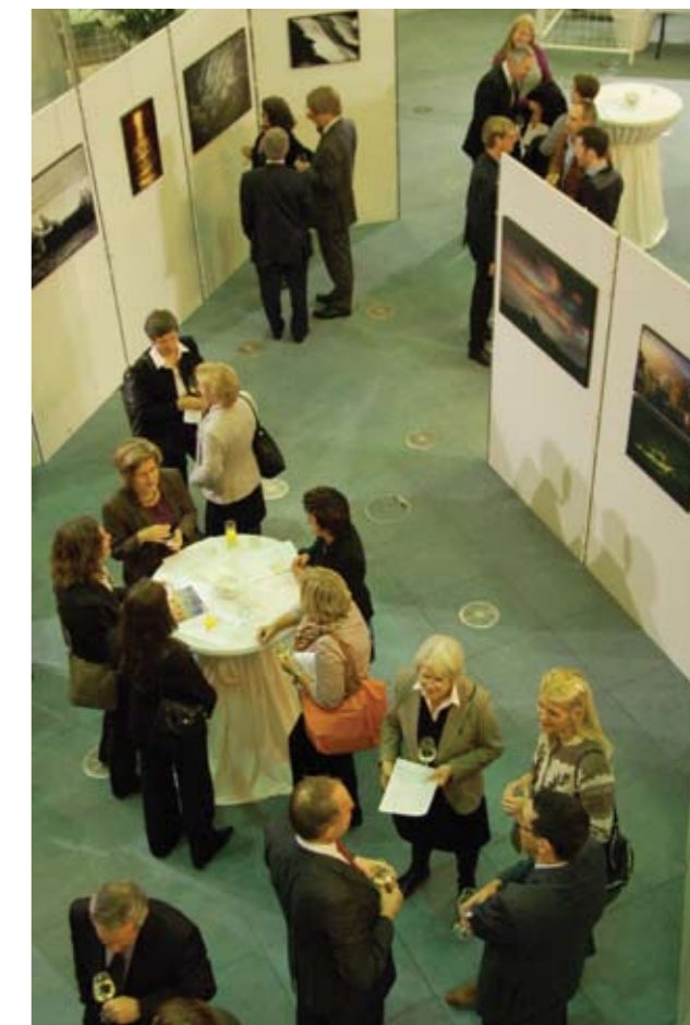
Fra åpningen av fotokunstutstilling i Brussel.