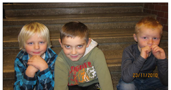
Disse flotte førsteklasingene er glade i matematikk og lek.