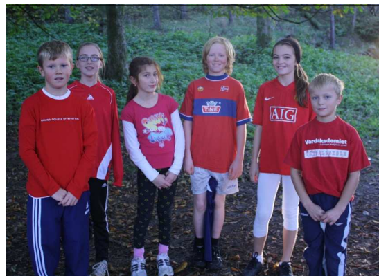
Løperne på etappe tre er klar for innsats!

De aller fleste som sykler har lys, hjelm og refleksvest. Det er FLOTT!