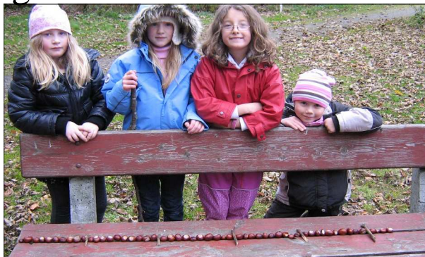
Kastanjenøtter og matematikk passer godt sammen.