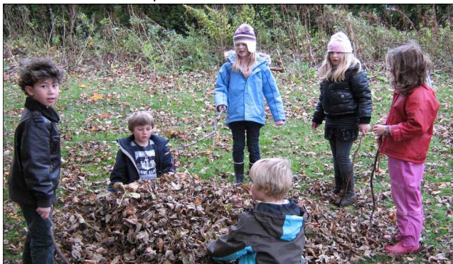
Deilig å boltre seg i en haug med løv.